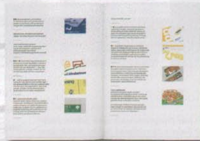
linke Seite: Koop von außen: Paperback mit Glanz rechte Seite: Koop von innen: das schöne Leben und Schaffen im Allgäu